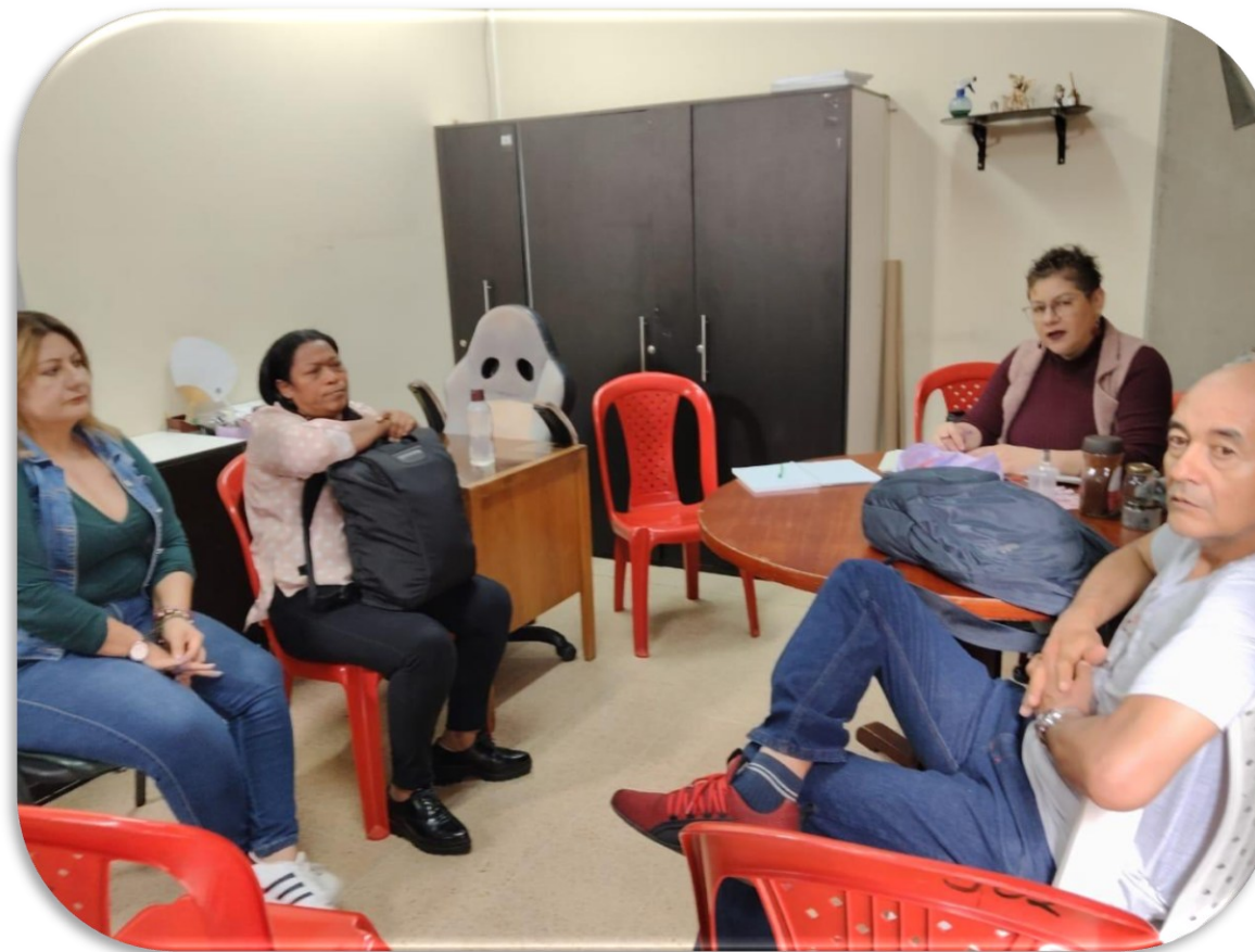
CONFORMACION COMITÉ AMBIENTAL